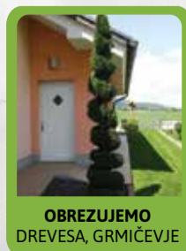
OBREZUJEMO DREVEŠA, GRMIČEVJE