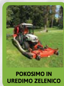
POKOSIMO IN UREDIMO ZELENICO

Bodite ponosni na svojo okolico - dovolite, da vam pri tem pomagamo.