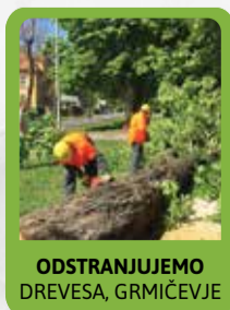
ODSTRANJUJEMO DREVEŠA, GRMIČEVJE