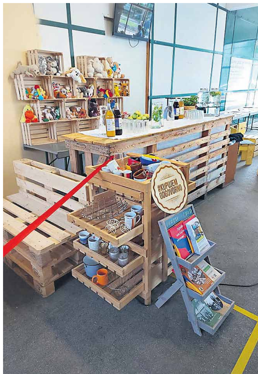
Kotichek ponovne uporabe v trgovini Zelena japka na mali tržnici

je izpostavil, da takšni projekti prispevajo k zmanjšanju količine odpadkov in nasploh k skrbi za okolje. "Upam, da ne bomo zapravili tega, da lahko pijemo čisto pitno vodo iz pipe, in da bomo počasi tudi skeptike pripravili do tega, da pridejo po živila na tržnice," je dejal. Direktor Dover je še dodal, da bi podobne koticheke radi uredili tudi pri drugih zbirnih centrih in odprli še kakšnega, saj se zelo pozna zaprtje nekdanjega centra na Lackovi cesti v Radvanju.