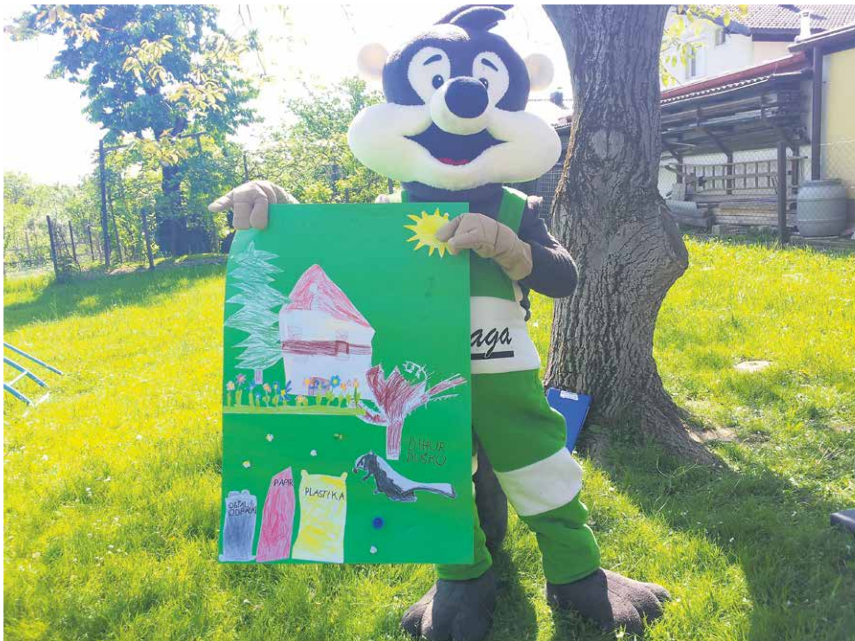
Maskota Duško pomaga otrokom spoznavati pomen odgovornega ravnanja z odpadki.